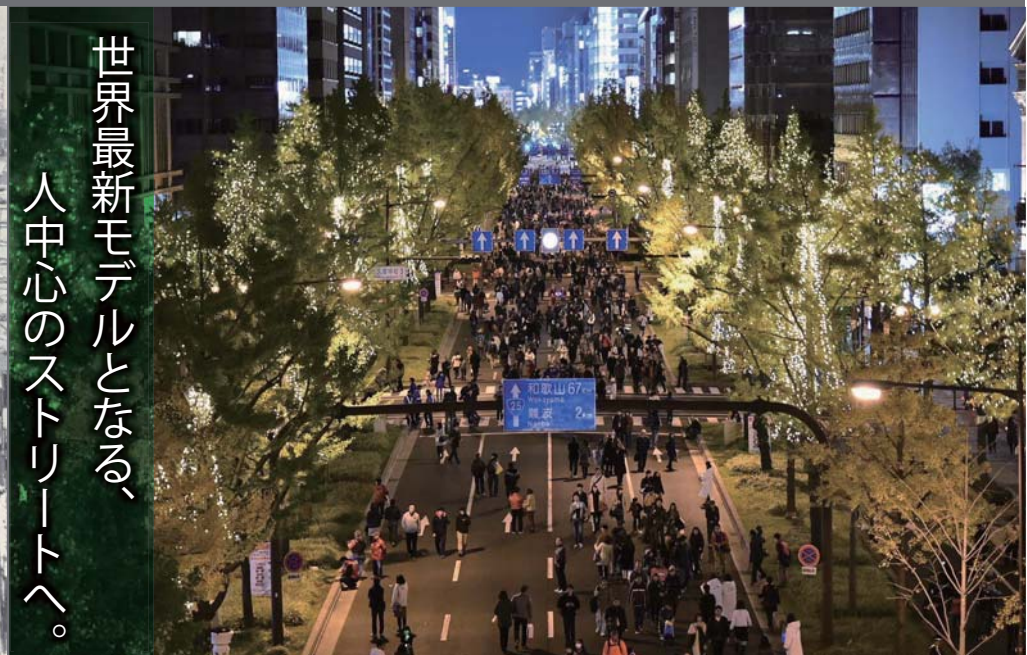
(写真) 平成 28 年：御堂筋オータムパーティー