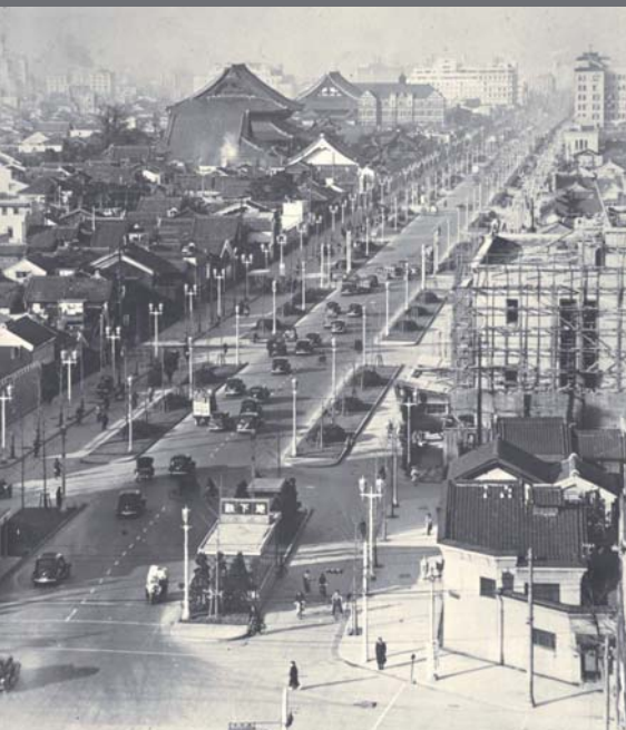
(写真) 昭和 12 年：完成当時の御堂筋