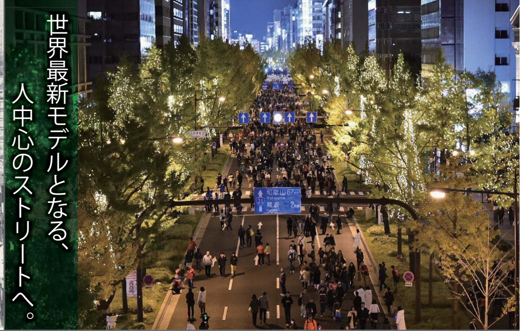
(写真) 平成 28 年：御堂筋オータムパーティー