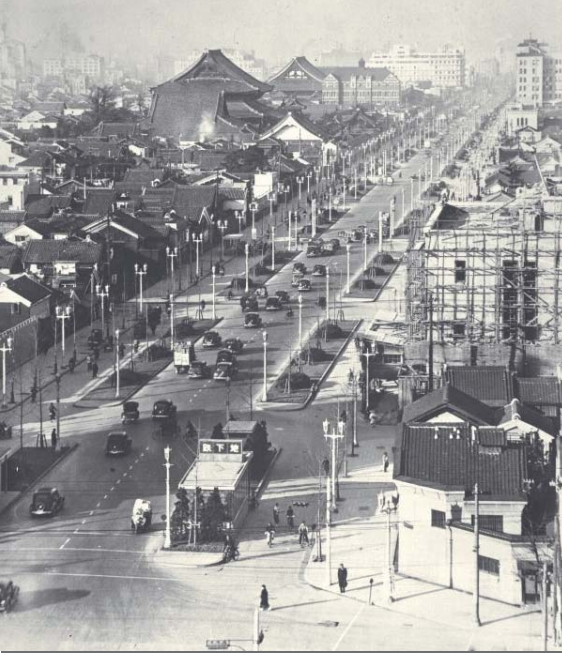
(写真) 昭和 12 年：完成当時の御堂筋