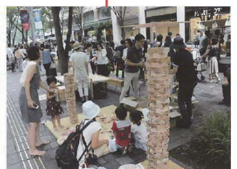
【企業による企画イベント】 (大丸有・仲通り)