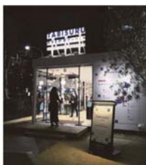
【インフォメーション & ショップ】