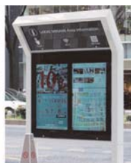
【デジタルサイネージ】