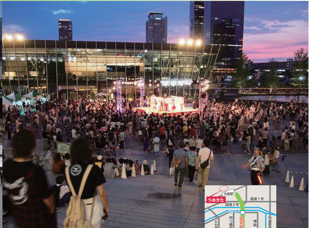
(写真) うめきた広場でのイベント ～小粋な街あそび～ 梅田ゆかた祭 2017