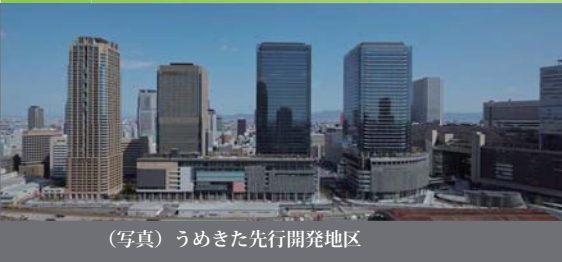
(写真) うめきた先行開発地区