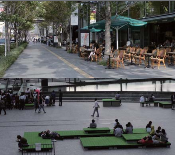
(写真上) 道路占用特例措置の制度を活用した道路空間でのオープンカフェ (写真下) (一社) グランフロント大阪 TMO によるうめきた広場の管理運営